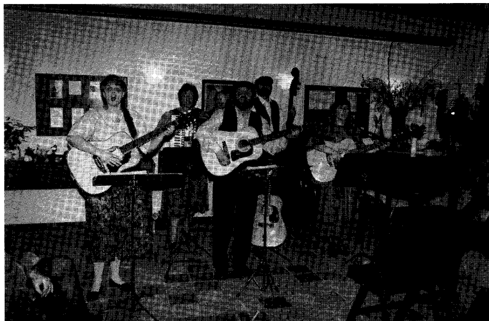
Die Gruppe »Blinkfuer« im neuen Bürgerhaus (alte Feuerwehr)