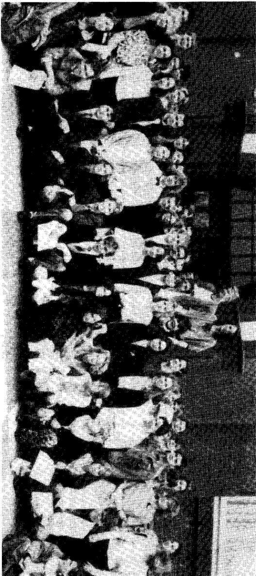
68 Schüler haben in der Aula des Werner-Heisenberg-Gymnasiums ihr Abiturzeugnis erhalten