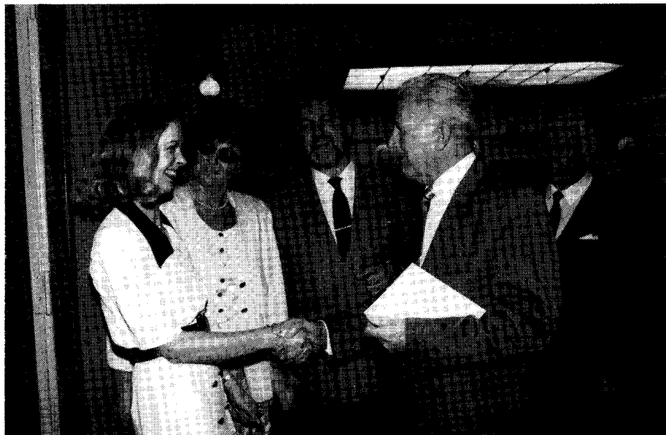
Empfang: 125 Jahre »Tivoli«